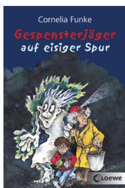
Gespensterjäger auf eisiger Spur