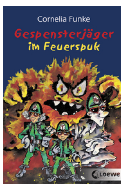
Gespensterjäger im Feuerspuk