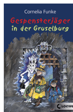
Gespensterjäger in der Gruselburg