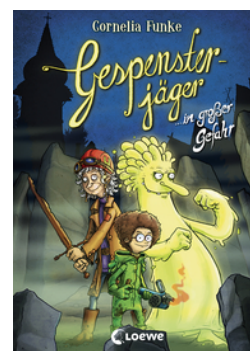
Gespensterjäger in großer Gefahr