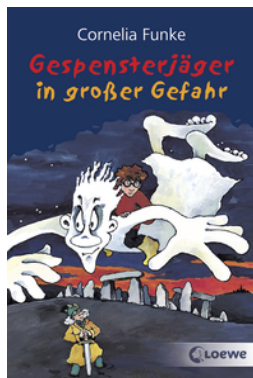
Gespensterjäger in großer Gefahr