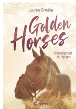
Golden Horses (Band 3) - Freundschaft im Herzen