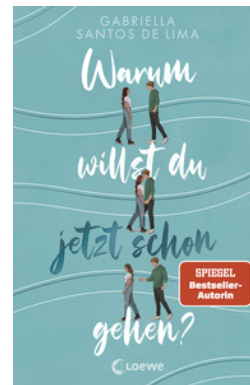
Warum willst du jetzt schon gehen?