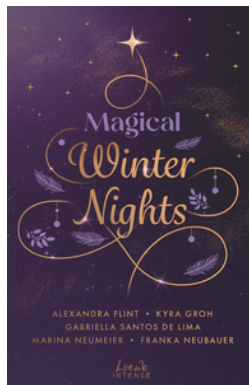
Magical Winter Nights