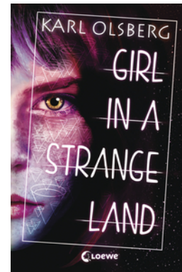
Girl in a Strange Land