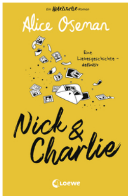
Nick & Charlie (deutsche Ausgabe)