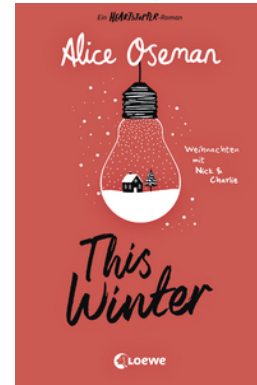
This Winter (deutsche Ausgabe)