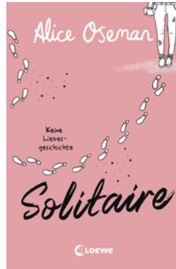
Solitaire (deutsche Ausgabe)