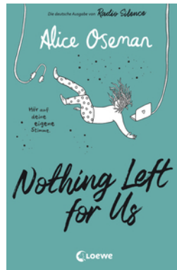
Nothing Left for Us (deutsche Ausgabe von Radio Silence)