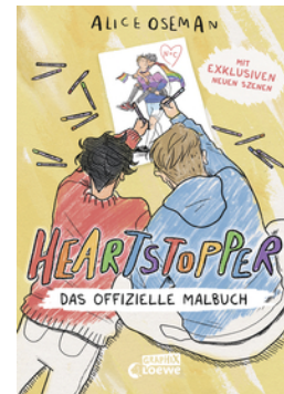
Heartstopper - Das offizielle Malbuch