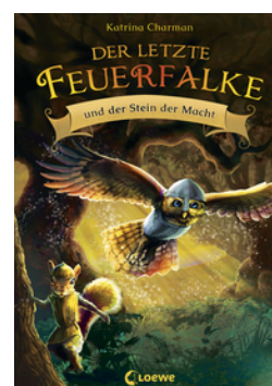
Der letzte Feuerfalk und der Stein der Macht (Band 1)