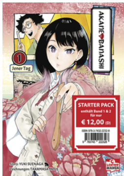
Akane-banashi Starter Pack