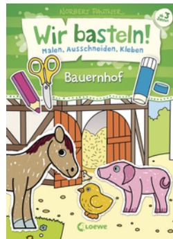
Wir basteln! - Malen, Ausschneiden, Kleben - Bauernhof