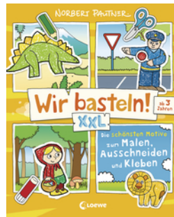
Wir basteln! XXL - Die schönsten Motive zum Malen, Ausschneiden und Kleben (gelb)