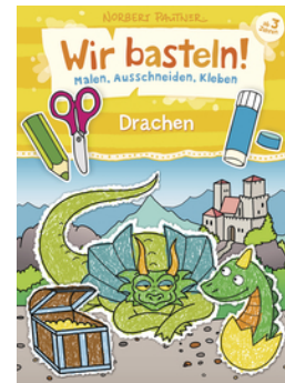
Wir basteln! - Malen, Ausschneiden, Kleben - Drachen