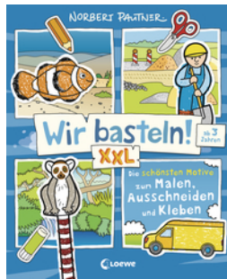
Wir basteln! XXL - Die schönsten Motive zum Malen, Ausschneiden und Kleben (blau)