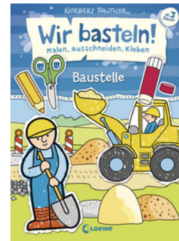
Wir basteln! - Malen, Ausschneiden, Kleben - Baustelle