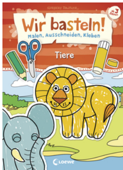
Wir basteln! - Malen, Ausschneiden, Kleben - Tiere