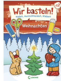
Wir basteln! - Malen, Ausschneiden, Kleben - Weihnachten