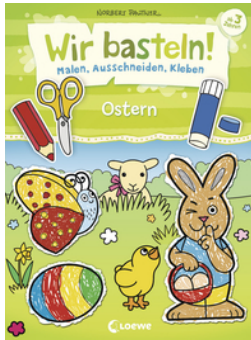
Wir basteln! - Malen, Ausschneiden, Kleben - Ostern