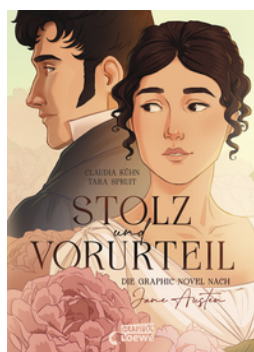
Stolz und Vorurteil