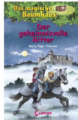
Das magische Baumhaus (Band 2) - Der geheimnisvolle Ritter