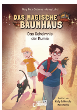
Das magische Baumhaus (Comic-Buchreihe, Band 3) - Das Geheimnis der Mumie