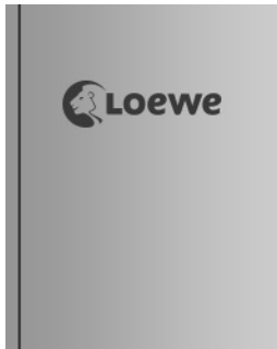
Mein Buchcafé in einer anderen Welt 05