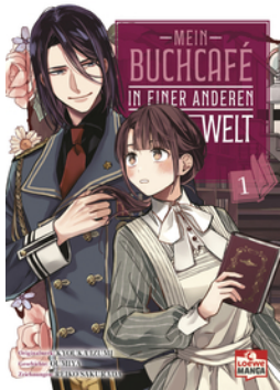
Mein Buchcafé in einer anderen Welt 01