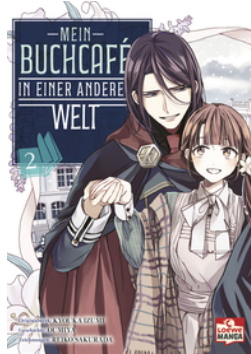
Mein Buchcafé in einer anderen Welt 02