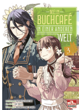
Mein Buchcafé in einer anderen Welt 03