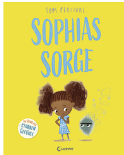
Sophas Sorge (Die Reihe der starken Gefühle)