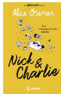
Nick & Charlie (deutsche Ausgabe)