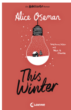
This Winter (deutsche Ausgabe)