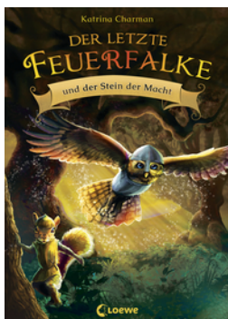
Der letzte Feuerfalke und der Stein der Macht (Band 1)