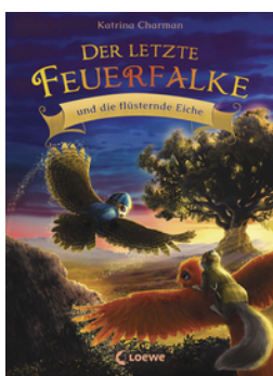
Der letzte Feuerfalke und die flüsternde Eiche (Band 3)