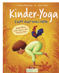
Kinder-Yoga zum Aufwachen