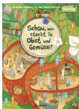
Schau, was steckt in Obst und Gemüse?