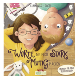
Worte, die mich stark und mutig machen