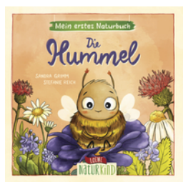
Mein erstes Naturbuch - Die Hummel