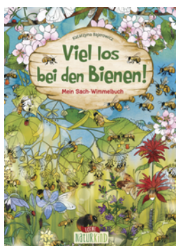
Viel los bei den Bienen!