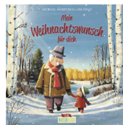
Mein Weihnachtswunsch für dich