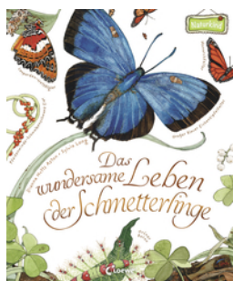
Das wundersame Leben der Schmetterlinge