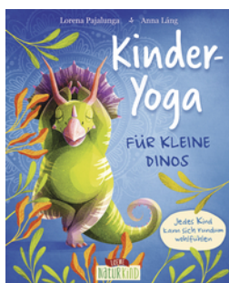
Kinder-Yoga für kleine Dinos