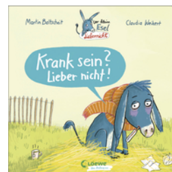
Der kleine Esel Lieber nicht - Krank sein? Lieber nicht!