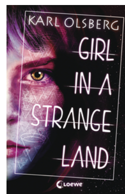
Girl in a Strange Land