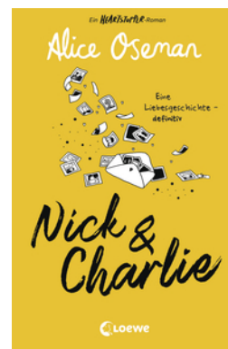
Nick & Charlie (deutsche Ausgabe)