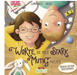
Worte, die mich stark und mutig machen