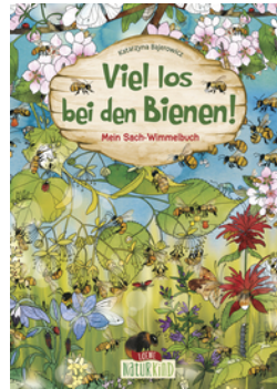
Viel los bei den Bienen!