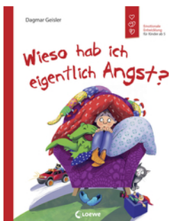
Wieso hab ich eigentlich Angst? (Starke Kinder, glückliche Eltern)