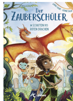
Der Zauberschüler (Band 3) - Im Schatten des roten Drachen