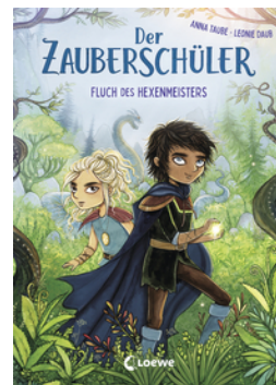
Der Zauberschüler (Band 1) - Fluch des Hexenmeisters