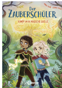
Der Zauberschüler (Band 4) - Kampf um die Magische Quelle