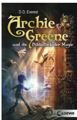
Archie Greene und die Bibliothek der Magie (Band 1)