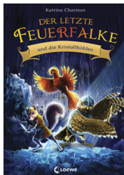
Der letzte Feuerfalke und die Kristallhöhlen (Band 2)