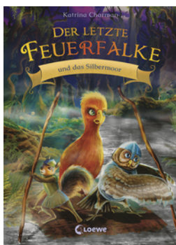
Der letzte Feuerfalke und das Silbermoor (Band 8)