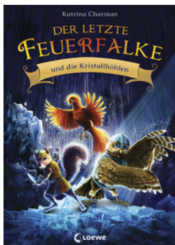
Der letzte Feuerfalke und die Kristallhöhlen (Band 2)