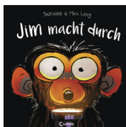
Jim macht durch