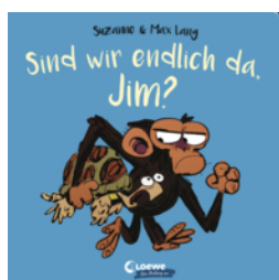
Sind wir endlich da, Jim?