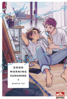
Good Morning Sunshine 01