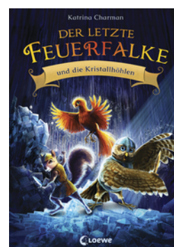
Der letzte Feuerfalke und die Kristalhöhlen (Band 2)