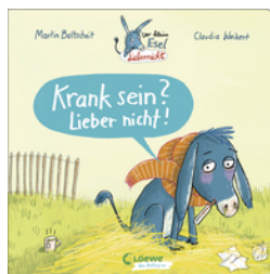
Der kleine Esel Lieber nicht - Krank sein? Lieber nicht!