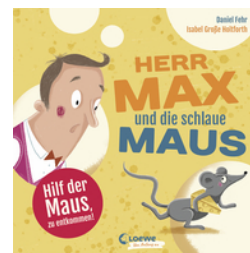
Herr Max und die schlaue Maus