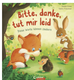
Bitte, danke, tut mir leid