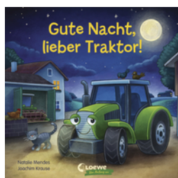
Gute Nacht, lieber Traktor!