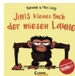
Jims kleines Buch der miesen Laune