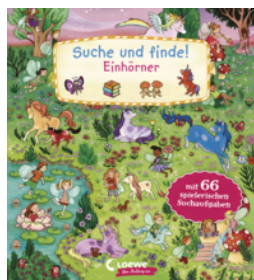
Suche und finde! Einhörner