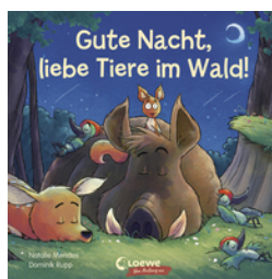
Gute Nacht, liebe Tiere im Wald!