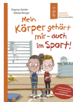
Mein Körper gehört mir - auch im Sport! (Starke Kinder, glückliche Eltern)