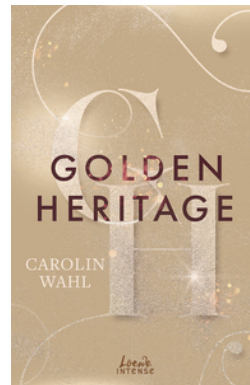
Golden Heritage (Crumbling Hearts, Band 2)