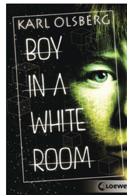
Boy in a White Room