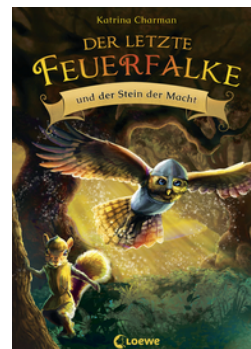
Der letzte Feuerfalke und der Stein der Macht (Band 1)