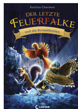
Der letzte Feuerfalke und die Kristalhöhlen (Band 2)