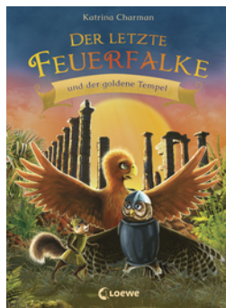
Der letzte Feuerfalke und der goldene Tempel (Band 9)