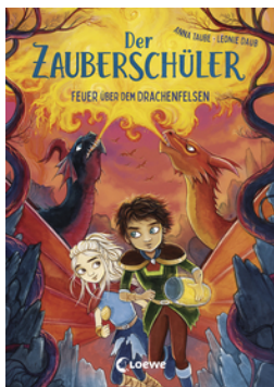
Der Zauberschüler (Band 6) - Feuer über dem Drachenfelsen