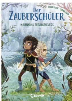
Der Zauberschüler (Band 2) - Im Bann des Seeungeheuers