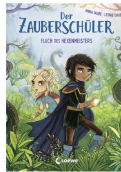
Der Zauberschüler (Band 1) - Fluch des Hexenmeisters