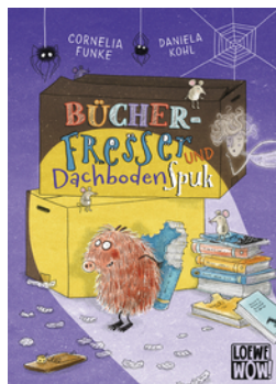
Bücherfresser und Dachbodenspuk