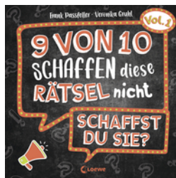
9 von 10 schaffen diese Rätsel nicht - schaffst du sie? - Vol. 1