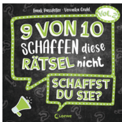
9 von 10 schaffen diese Rätsel nicht - schaffst du sie? - Vol. 2