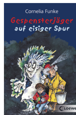
Gespensterjäger auf eisiger Spur