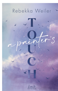
A Painter's Touch (Broken Artists, Band 3)