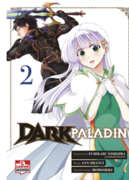
Dark Paladin 02