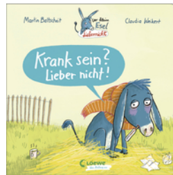
Der kleine Esel Lieber nicht - Krank sein? Lieber nicht!