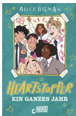
Heartstopper - Ein ganzes Jahr (Yearbook)