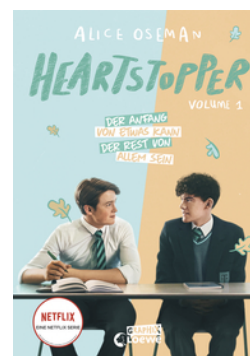
Heartstopper Volume 1