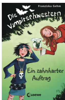
Die Vampirschwestern (Band 3) - Ein zahnharter Auftrag