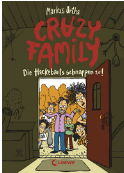
Crazy Family (Band 2) - Die Hackebarts schnappen zu!