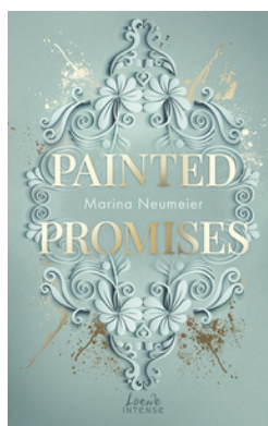
Painted Promises (Golden Hearts, Band 3)