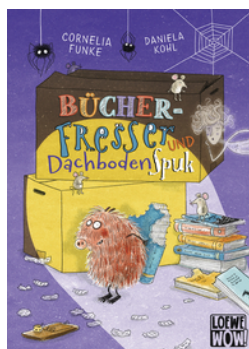
Bücherfresser und Dachbodenspuk