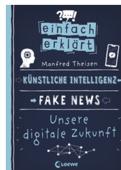
Einfach erklärt - Künstliche Intelligenz - Fake News - Unsere digitale Zukunft