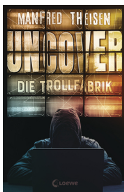
Uncover - Die Trollfabrik