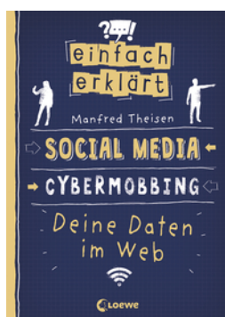
Einfach erklärt - Social Media - Cybermobbing - Deine Daten im Web