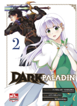
Dark Paladin 02