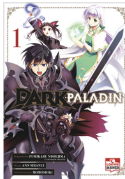
Dark Paladin 01