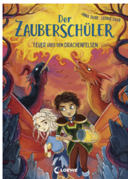
Der Zauberschüler (Band 6) - Feuer über dem Drachenfelsen