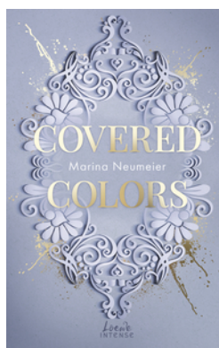
Covered Colors (Golden Hearts, Band 2)