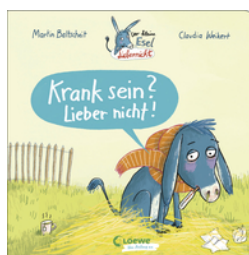
Der kleine Esel Lieber nicht - Krank sein? Lieber nicht!